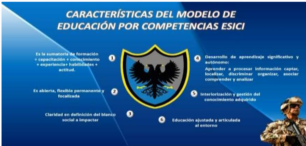
Figura 1. Modelo educativo por competencia (propia ESICI)

De igual manera el currículo basado en la formación por competencias permite desarrollar los campos de formación de acuerdo con la transversalización de los saberes que reconocen el desarrollo de las competencias. La formación integral se concibe en la ESICI como aquella formación soportada en diez (10) pilares filosóficos, que le permiten desarrollar las competencias del Ser, Saber, Hacer y Convivir a los estudiantes, para el cumplimiento de su Misión: “entrenar, capacitar, formar y especializar a los futuros profesionales en inteligencia, contrainteligencia, seguridad y defensa nacional, como personas íntegras...”. Estos pilares son: