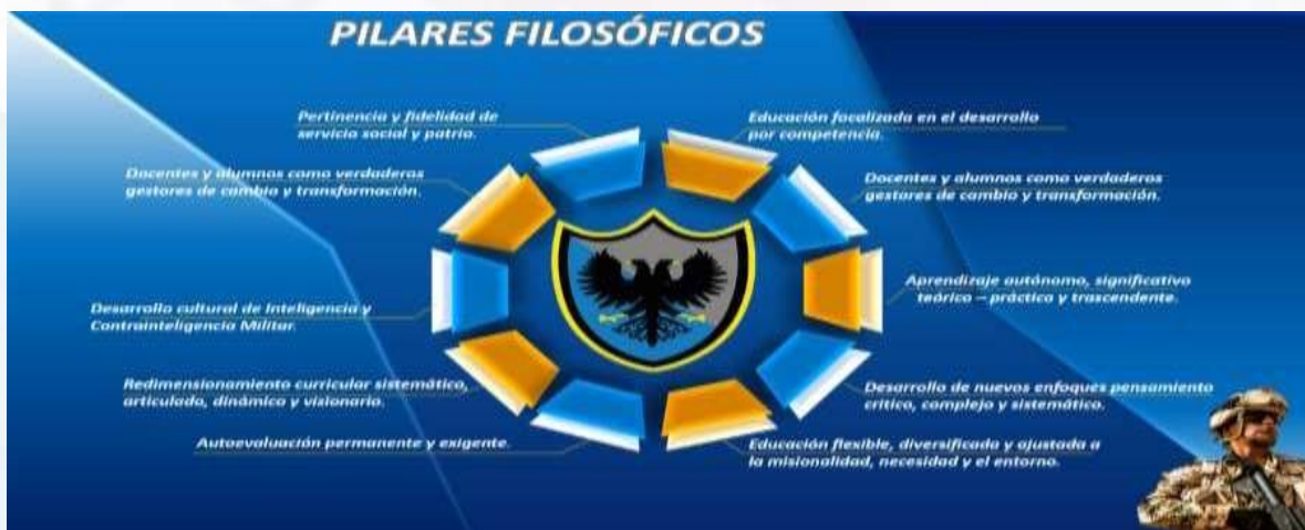
Figura 2. Modelo educativo por competencia (propia ESICI)

De igual manera el currículo basado en la formación por competencias permite desarrollar los campos de formación de acuerdo con la transversalización de los saberes que reconocen el desarrollo de las competencias. La formación integral se concibe en la ESICI como aquella formación soportada en diez (10) pilares filosóficos, que le permiten desarrollar las competencias del Ser, Saber, Hacer y Convivir a los estudiantes, para el cumplimiento de su Misión: “entrenar, capacitar, formar y especializar a los futuros profesionales en inteligencia, contrainteligencia, seguridad y defensa nacional, como personas íntegras...”. Estos pilares son: