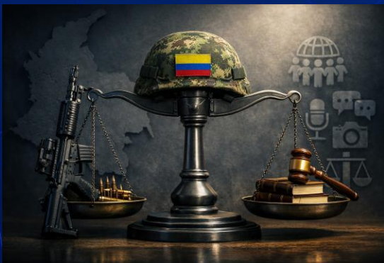
Imagen generada con IA

Actualidad en el contexto colombiano: Judicialización del conflicto y uso coordinado de narrativa pública para erosionar legitimidad. Sincronización entre narrativa mediática y acción jurídica: Influencia sobre la opinión pública como multiplicador del efecto deslegitimador en las actuaciones de la fuerza pública, generando un cuestionamiento sobre cualquier tipo de actividad militar.